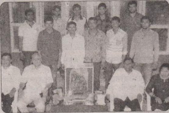
कबड्डी स्पर्धेमध्ये भारती विद्यापीठाच्या डॉ. पतंगराव कदम महाविद्यालयाने द्वितीय क्रमांक प्राप्त केला.