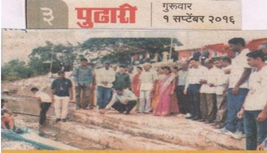
सांगली : शिवाजी विद्यापीठ आंतरविभागीय रोईंग स्पर्धा उत्साहात झाल्या.