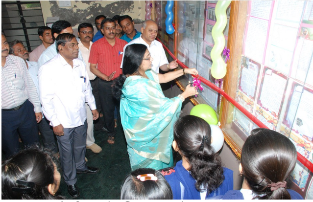
मा.सौ.वहिनीसाहेब भित्तीपत्रकाचे उद्घाटन करताना ....