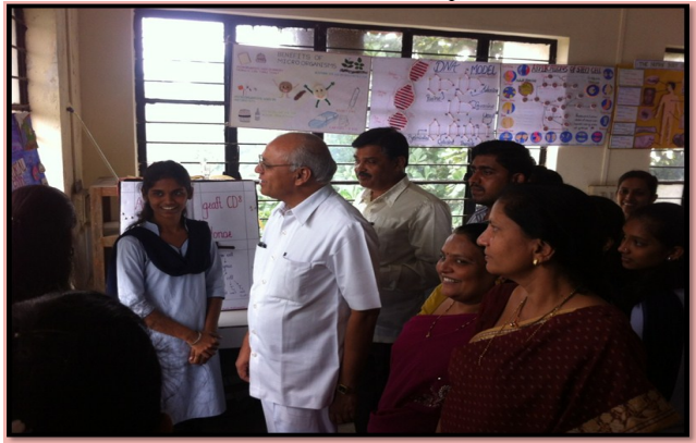
मायक्रोबायोलोजी विभागाच्या पोस्टर प्रदर्शन प्रसंगी मा.प्राचार्य व इतर प्राध्यापक