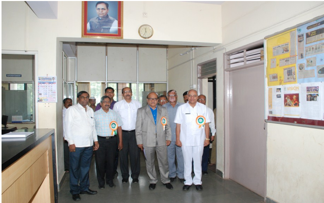
मान्यवरांच्या महाविद्यालय भेटीप्रसंगी मा.प्राचार्य व इतर मान्यवर