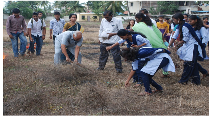
महाविद्यालयात स्वच्छता मोहिमे प्रसंगी मा.प्राचार्य व इतर मान्यवर