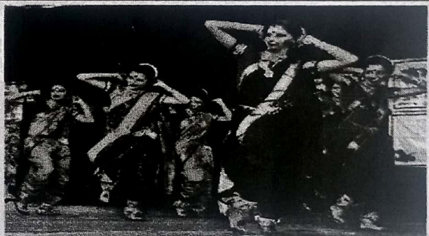
सांगलीवाडीतील डॉ. परतगराव कदम महाविद्यालयात बुधवारी पार पडलेल्या युवा महोत्सवात इस्लामपूरच्या कन्या महाविद्यालयाच्या मुलींनी आदिवत्सी नृत्य सादर केले. दुसऱ्या घाट्याघिनात कडेगावच्या बयाबाई कदम महाविद्यालयाने बहारदार लोकगीत सादर करून मने जिंकली.