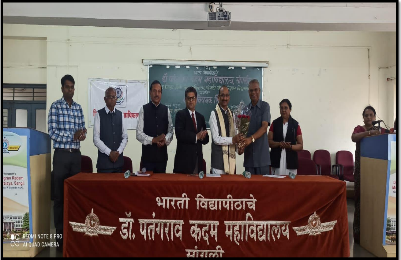
Felicitation of Chief Guests